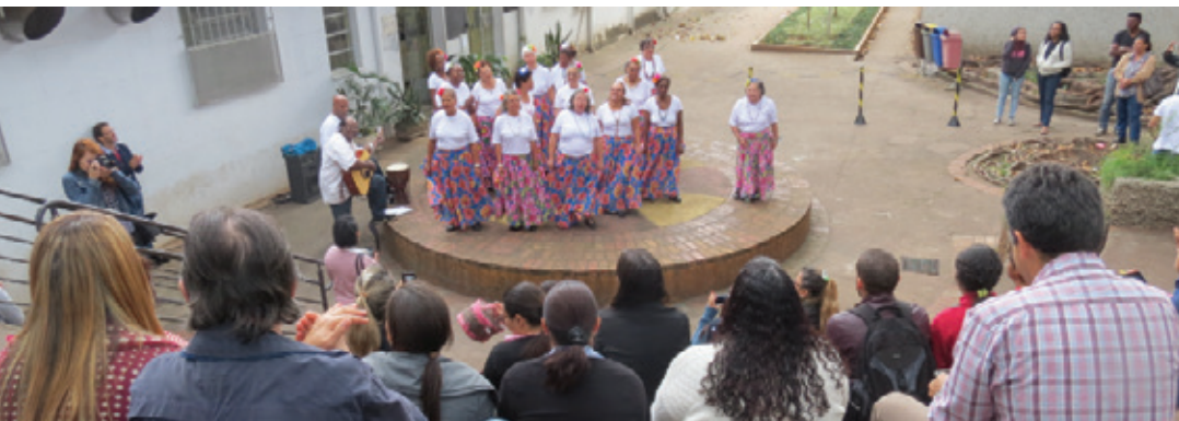
Ciranda de Minas: alegria e descontração na hora do almoço