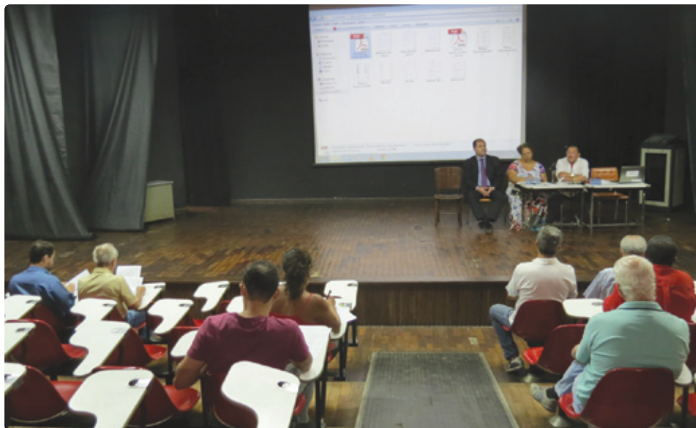
Assembleia Estatutária da Assufemg foi realizada no auditório da Escola de Belas Artes

A Assembleia Estatutária (AE) da Associação dos Servidores da Universidade Federal de Minas Gerais - ASSUFEMG, convocada antecipadamente conforme determina seu Estatuto, foi realizada no dia 10 de dezembro de 2014, no Auditório da Escola de Belas Artes da UFMG, Campus Pampulha quando, constatado o quórum necessário para a instalação da mesma, deliberou-se sobre a aprovação da prestação de contas referentes aos exercícios dos anos de 2012 e 2013, que foi aprovada por unanimidade, pelos presentes.