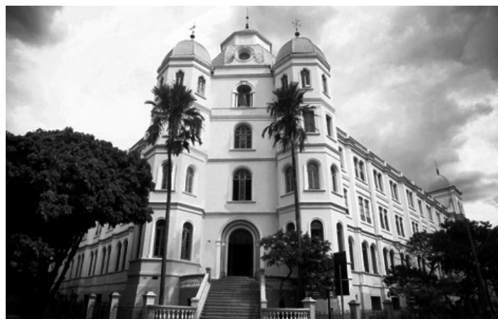
A Faculdade Arnaldo funciona no mesmo prédio do Colégio Arnaldo, no bairro Funcionários, e já é referência em Administração e Direito.

Os cursos de Administração e Direito oferecidos pela Faculdade Arnaldo Janssen propiciam uma sólida formação humanística, unindo a sabedoria e a tradição no ensino às exigências do mercado moderno. Mesmo com poucos anos de atuação, a Faculdade Arnaldo Janssen já se tornou referência no ensino superior. O corpo docente da Faculdade Arnaldo é formado por mestres e doutores de reconhecida competência acadêmica e ampla experiência profissional no mercado.