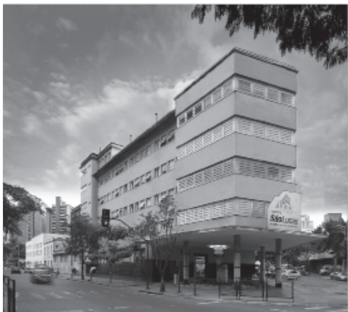
Ed. Gustavo Xavier - Foto Ambiente

O Hospital São Lucas, inaugurado em 1922, possui tradição e excelência na prestação de serviços de saúde. Situado na região hospitalar de Belo Horizonte, próximo à Praça Hugo Werneck, o Hospital possui instalações de alto nível e todo o suporte tecnológico necessário para a realização de cirurgias de média e alta complexidade, além de médicos renomados, equipe multidisciplinar e atendimento humanizado. Com cerca de 100 leitos, 20 boxes de CTI e oito de UCI, possui amplos apartamentos de luxo, equipados com frigobar, TV a cabo e telefone. O ele-