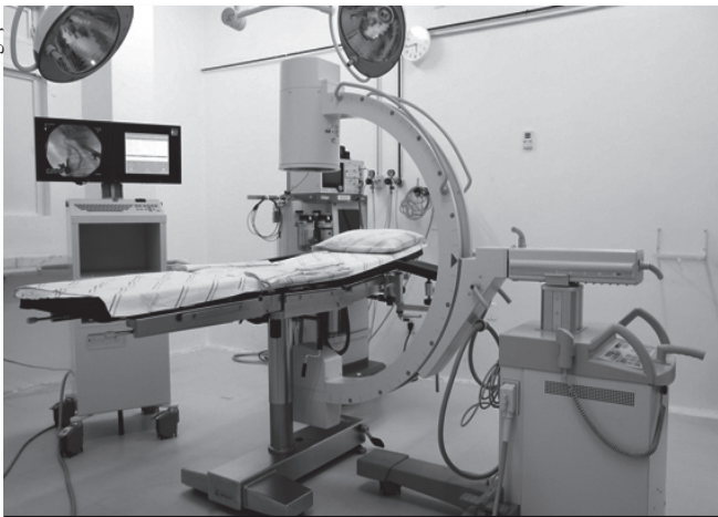
Aparelho arco cirúrgico utilizado no Bloco cirúrgico do Hospital São Lucas

O Pronto Atendimento São Lucas atende adultos e crianças em situação de urgência/emergência, em regime de plantão, 24 horas. Possui especialistas altamente capacitados nas áreas de ortopedia, pediatria, cirurgia, cardiologia e clínica médica. Por localizar-se dentro do Complexo Hospitalar São Lucas, os pacientes que necessitam de internação ou procedimentos cirúrgicos de urgência/emergência contam com todo o suporte do Hospital. O endereço do Pronto Atendimento São Lucas é Rua dos Otoni, 670 – Santa Efigênia. O telefone é (31) 3238-8597.