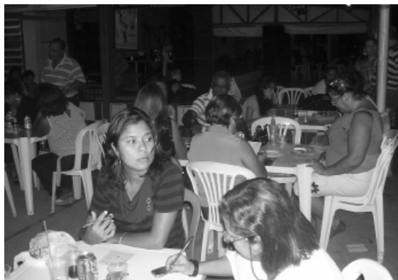
...divertiu os presentes,