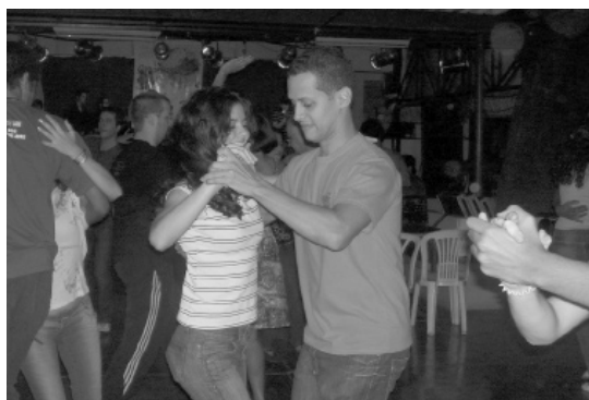
...assim como, o ritmo da Gafieira...