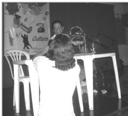
A tradicional rodada de Bingo...