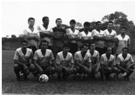
Rosas de Abril 1991

Como parte integrante das comemorações dos 38 anos de atividades da Associação dos Servidores da UFMG-Assufemg, o Torneio Rosas de Abril de Futebol de Campo será realizado nos dias 14 (sábado) e 28 de abril (sábado) às 9horas, no campo da FAE (Centro Pedagógico).